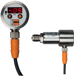
23326 - Druckschalter