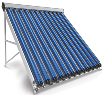
Abb. 3: Vakuumröhrenkollektor

Vakuumröhrenkollektoren benötigen im Vergleich zu Flachkollektoren weniger Platz, um die gleiche Leistung zu erzielen und haben einen höheren Wirkungsgrad.