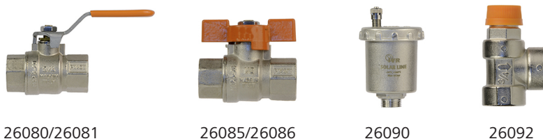
Abb. 6: Nussbaum Armaturen für hohe Temperaturen