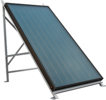
Abb. 2: Thermischer Flachkollektor

Ein thermischer Flachkollektor zeichnet sich durch seine besonders niedrige Bauhöhe aus. Unter dem Absorberblech befindet sich ein Rohrsystem, durch das die Wärmeträgerflüssigkeit fließt. Als Wärmeträgerflüssigkeit wird ein Wasser-Frostschutz-Gemisch eingesetzt. Durch die Zugabe des Frostschutzmittels wird sichergestellt, dass das Wasser bei Minusgraden nicht gefriert und die Anlage vor Beschädigungen durch Frost geschützt ist. Für die Wärmedämmung werden herkömmliche Dämmstoffe verwendet.