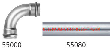
Abb. 5: Optipress-Therm-Bogen 90° und Optipress-Therm-Rohr

Nussbaum empfiehlt Optipress-Therm hauptsächlich im Innenbereich.