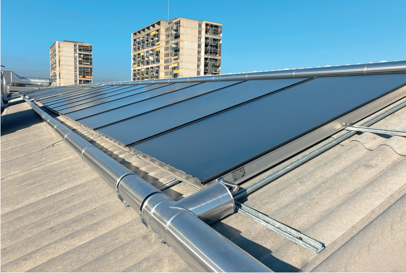
Abb. 7: Installation einer Flachkollektoren-Solaranlage auf dem Dach mit Optipress

Das folgende Beispiel zeigt eine Flachkollektoren-Solaranlage mit einer Neigung von 20° und einer Kollektorfläche von 140 m 2 mit Anschluss an isolierte Optipress-Edelstahlrohre 1.4520 und Optipress-Aquaplus-Fittings.